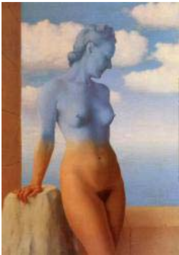
La Magie Noire - 1942 - René Magritte

Ela parou diante dele, puxou o véu, debaixo do qual apareceram olhos negros, franjas e pálpebras longas com cílios cuidadosamente alongados; suas partes eram delicadas e perfeitas suas características, conforme disse a seu respeito um dos que a descreveu: